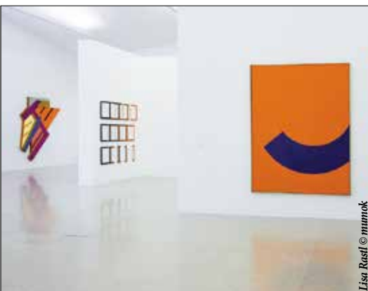
Lisa Restl © mumok

Время работы: ежедневно – с 10 до 19, по понедельникам – с 14 до 19, по четвергам – с 10 до 21 www.mumok.at